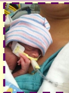
Prematuro com ventilação mecânica

Abaixo, seguem figuras de alguns meios de oxigenioterapia oferecidos durante a internação: