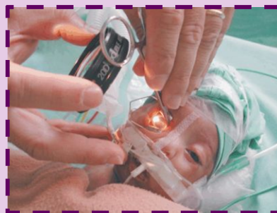
Anexo 1. http://www.deficienciavisual.pt/sd-retinopatiaprematuro.htm

Pode sentir um pouco de desconforto apenas devido ao uso da luz e do afastador de pálpebra.