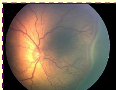
Retina com os vasos alterados durante o exame de fundo de olho.

tervalo de duas semanas. Recebendo alta hospitalar os bebês precisam continuar sob a supervisão do especialista em olhos até ocorrer a maturação da retina. O tratamento deve ser feito de acordo com o estágio de desenvolvimento da retinopatia.