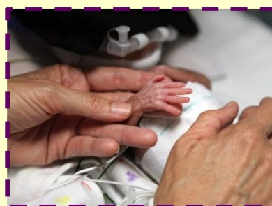
Prematuro com Baby pap