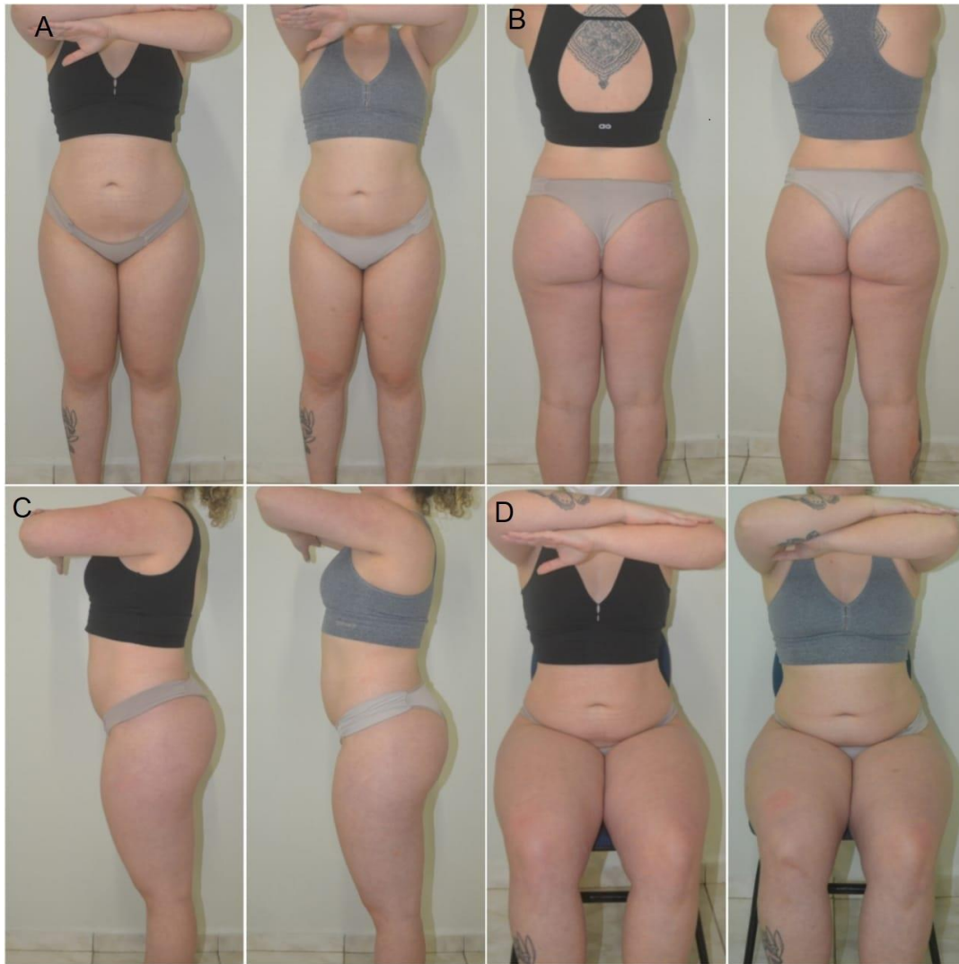
Figura 1. A- Vista anterior, B- Vista posterior, C- Vista lateral, D- Vista anterior sentada.