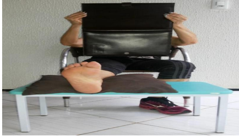
Figura 1- Posicionamento do participante para a avaliação da sensibilidade tátil da planta do pé.

No anteparo foi fixado uma foto colorida da planta do pé medindo (comprimento 30 cm x largura 22 cm), reproduzindo a mesma posição do pé que está sendo avaliado, conforme ilustra a figura 2.